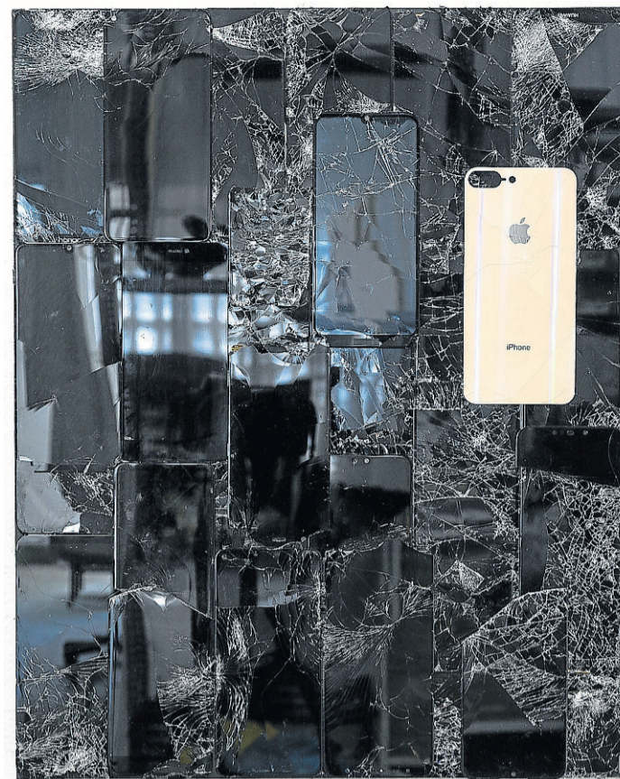
'Le Reflet VIII', una de las obras de Jorge Isla.

a concepto y discurso, algo que hoy en día aprecio mucho. No se quedan en la forma o en la obra como tal, tiene que haber algo detrás, un cuestionamiento, un concepto al servicio de la primera", valora.